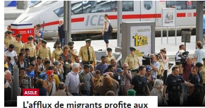
L'afflux de migrants profite aux patrons allemands L'Allemagne attend 800 000 migrants cette