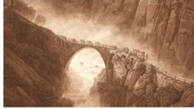
Le Pont du Diable dans les gorges de Schöllenen (Peter Birman). Source : Wikimedia Commons