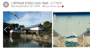
L'ÉPOQUE DE DOMINATION DU SHOGUNAT TOKUGAWA