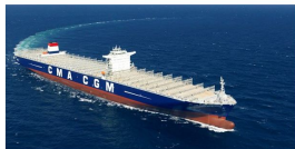
CMA CGM Marco Polo